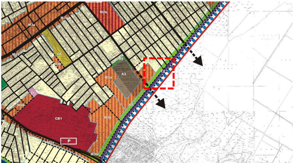
Extras din PUZ Sector 2, aprobat prin HCL nr 99/2003, în prezent expirat

Terenul aflat pe Strada Lanternei nr 157A se încadrează conform PUZ Sector 2, aprobat prin HCL nr 99/2003, în prezent expirat, în UTR V5 – zona de protecție pentru infrastructura tehnică.